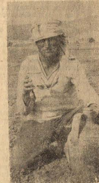
Yaz Güneşi Altında Yana Yana Yetistirilir Bu Tütün.