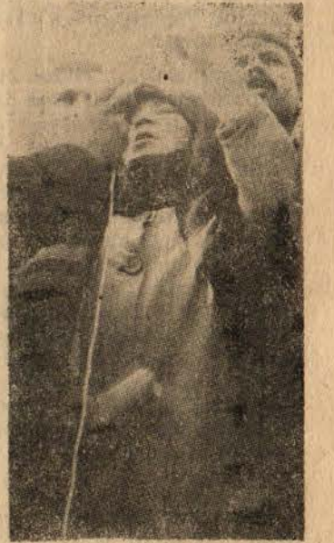
Yaşlı Bir Tütüncü Kadın Mitingte Konuşuyor.

Devrimci Mersin gençliği bir bildiri yayınladı. Yer yer halk, itleri kovdu. Soluğu kaçmakta olan Amerikalı-